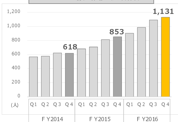
エンジニア数の推移 (四半期末)